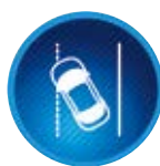
Sávelhagyásra figyelmeztető rendszer kormányrásegítéssel (LDA)

Egy radaros rendszer kamerák segítségével ellenőrzi, hogy a jármű előtti útszakaszon található-e más jármű vagy gyalogos. Amennyiben a rendszer egy ütközés kockázatát észleli, látható és hallható eszközökkel figyelmezteti a vezetőt, és egyben felkészíti a fékeket is a beavatkozásra.