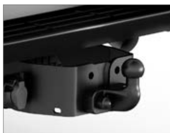
PEREMRE RÖGÍTETT VONÓHOROG