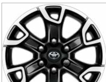
18" FEKETE, CSISZOLT HATÁSÚ KÖNNYŰFÉM KERÉKTÁRCSÁK