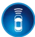
Ütközés előtti rendszer (PCS)

Egy radaros rendszer kamerák segítségével ellenőrzi, hogy a jármű előtti útszakaszon található-e más jármű vagy gyalogos. Amennyiben a rendszer egy ütközés kockázatát észleli, látható és hallható eszközökkel figyelmezteti a vezetőt, és egyben felkészíti a fékeket is a beavatkozásra.