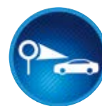
Jelzőtábla felismerőrendszer (RSA)

Egy kamera közreműködésével a rendszer figyeli a forgalmi sávokat elválasztó vonalakat, és audiovizuális jelekkel figyelmezteti a vezetőt, ha azt észleli, hogy a jármű az irányjelző működtetése nélkül készül elhagyni a sávot.